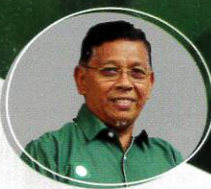
YB HJ HANAFIAH MAT N31 ADUN CUKAI